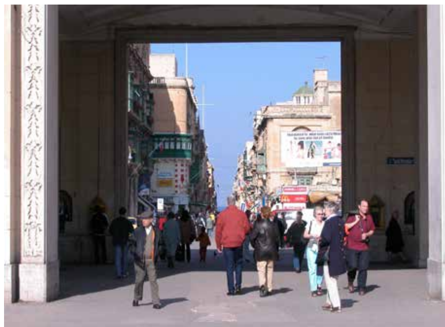
Byporten til Maltas hovedstad - johanniterriddernes vældige fæstningsby Valletta.

Når man er gået grundigt træt i Valletta og har fået store fødder, tager man tilbage til Mellieha med lokale busser.