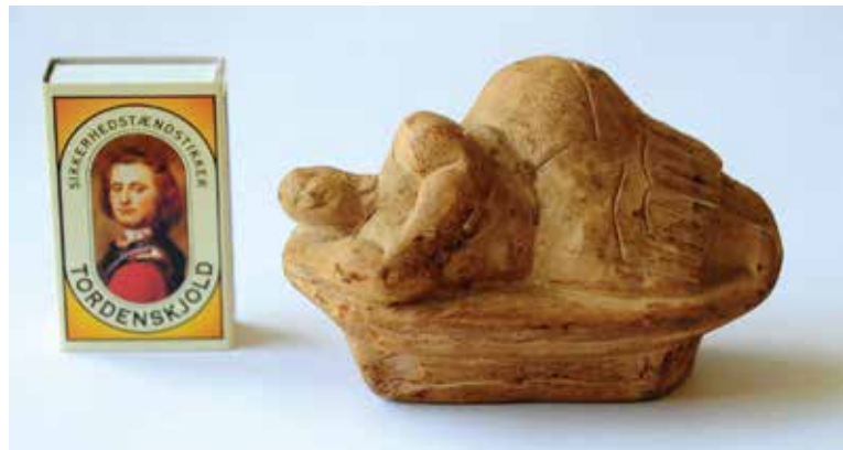
En kopi i størrelse 1:1 af "Den sovende gudinde."

Søndag d. 2. maj: Fri dag. Vi arrangerer en udflugt til stenalderhulerne Hal Saflieni Hypogeum, hvor tusinder af mennesker blev begravet for 3.000 til 5.000 år siden. Hulerne er hugget ud af kalkklippen for årtusinder siden og består af et netværk af gange og kamre med røde bemalinger, orakelrum og gravnicher. Den lille keramik-figur "Den sovende