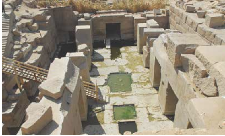
Det gådefulde Osirion tempel i Abydos

dødebyen Saqqara, hvor den første og ældste pyramide ligger (Zosers trinpyramide fra ca. år 2.600 f. Kr.). Saqqara var gravby og helligsted for den gamle, ægyptiske hovedstad Memfis, der blev grundlagt for ca. 5.000 år siden.