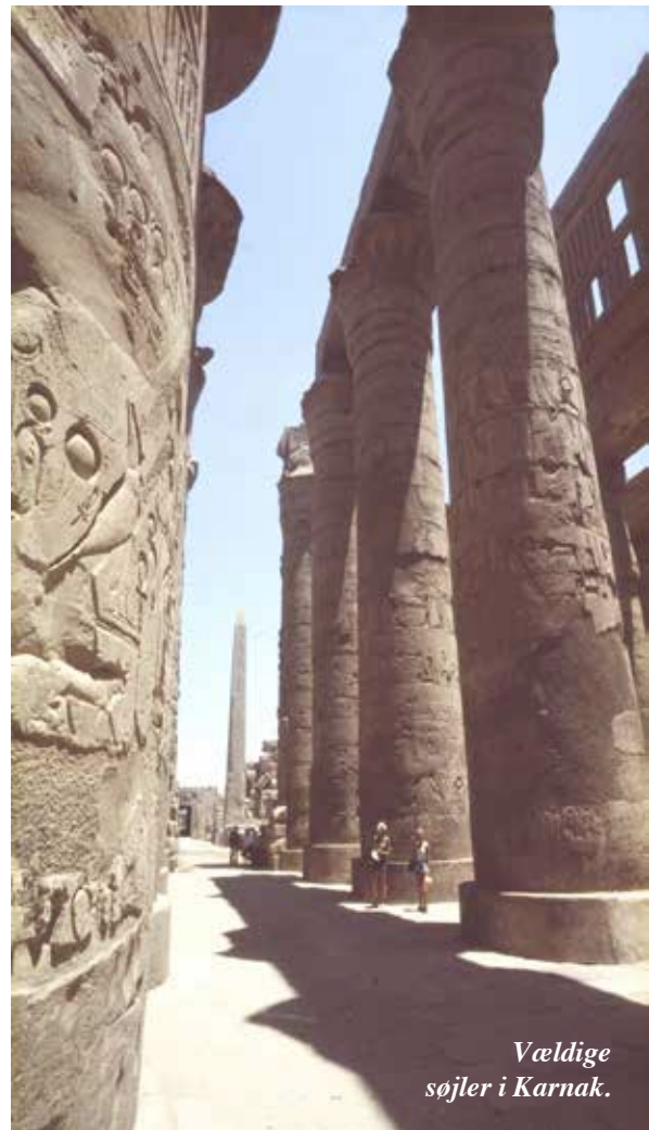
Vældige søjler i Karnak.

Vi vil prøve at nå det hele – uden at slide os selv op til sokkeholderne. Der skal også være tid til en kølig drik (eller flere) og til at nyde det øde og fremmedartede ørkenlandskab, oaserne og Nilen.