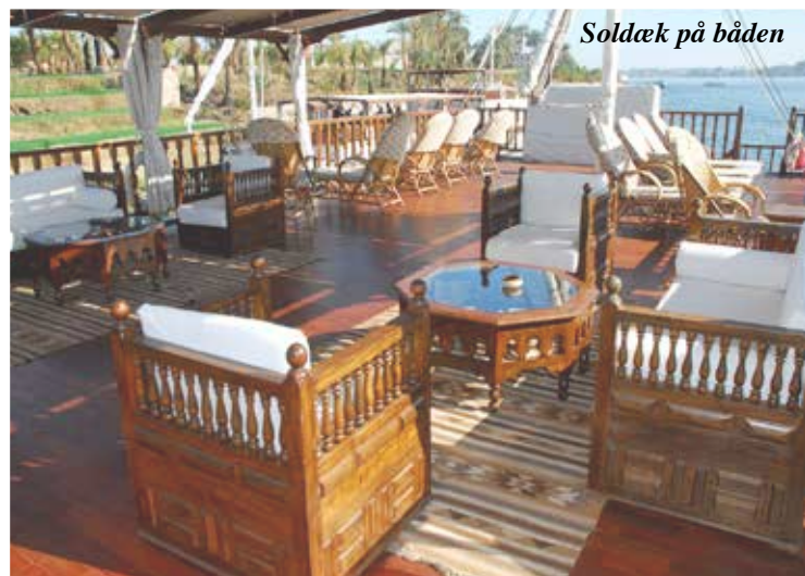
Soldæk på båden