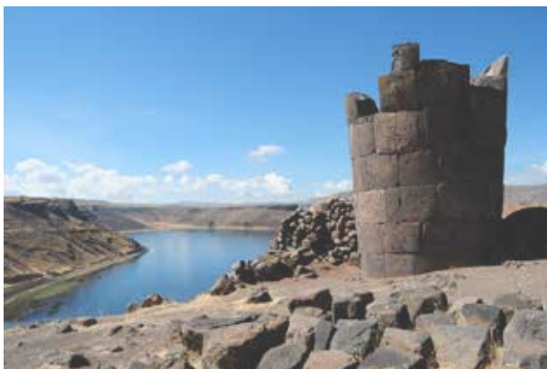
Gravtårn på Sillustani.

Efter frokost kører vi til grænsen mellem Peru og Bolivia. Herfra videre til Puno i Peru. Vi er fremme på vores hotel i Puno ved 18-tiden.