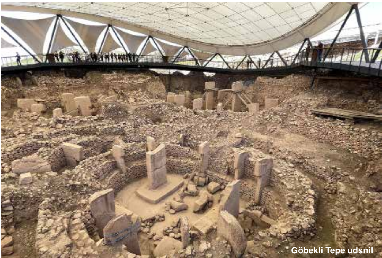
Göbekli Tepe udsnit