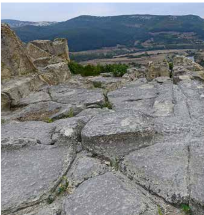
Nederste foto: Klippegrav på toppen af Perperikon. Den kaldes for "vampyrens grav" idet skeletresterne blev fundet sammen med en metal-amulet, der skulle sikre, at den døde holdt sig i sin grav...