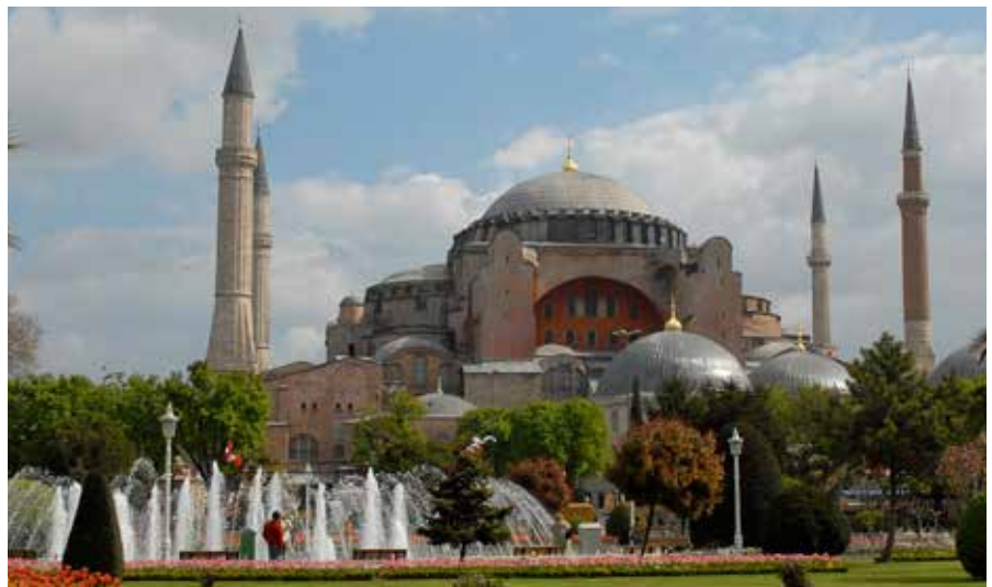
Øverst: Justinians cisterne. Flere af søjlerne er stjålet fra gamle fx. græske templer. Foto til venstre: Den snoede kobbersøjle stod oprindeligt foran Delfi templet i Grækenland. Den blev stjålet i byzantinsk tid og opstillet i hippodromen. Foto herover: Hagia Sophia kirken.

de runde stenhuse med fint tilhuggede søjler af hård limsten. Hver stenkreds måler fra 10 til 30 meter i diameter med mindre sten i periferien og højere sten i midten. Måske har kredse engang været overdækket med et tag. Mange af søjlerne er dekorerede med dyrefigurer og symboler i fremhævet relief. Kulstof 14 målinger har vist, at Göbekli Tepe er op mod 12.000 år gammelt. Tempelkomplekset er således med en bred margin det absolut ældste i verden. Før Göbekli Tepe var de godt 5.500 år gamle templer på Malta de ældst kendte i verden. Den videre