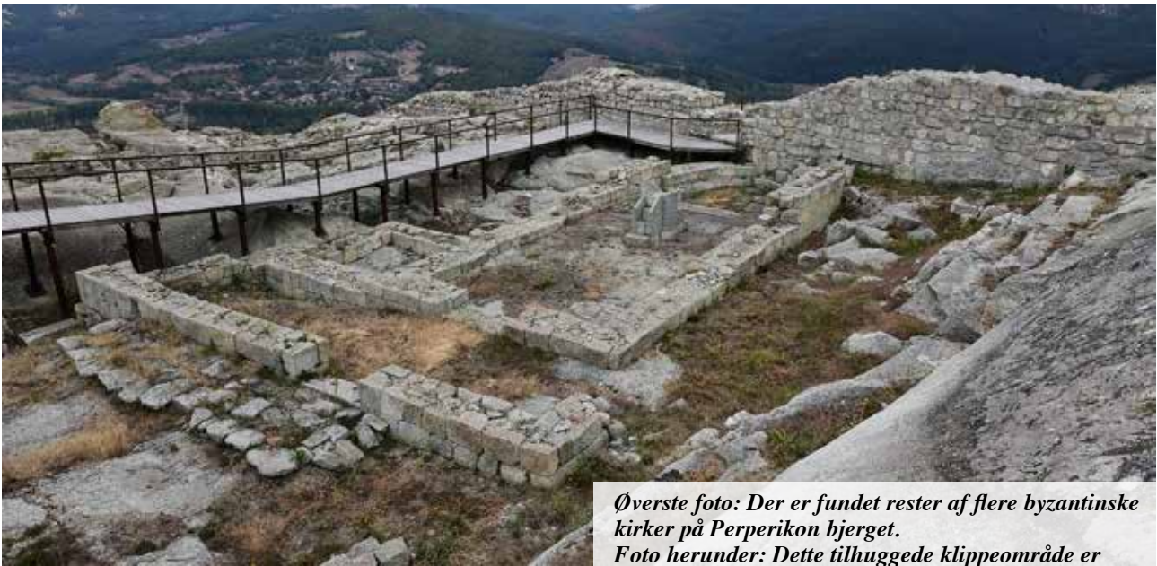
Øverste foto: Der er fundet rester af flere byzantinske kirker på Perperikon bjerget.