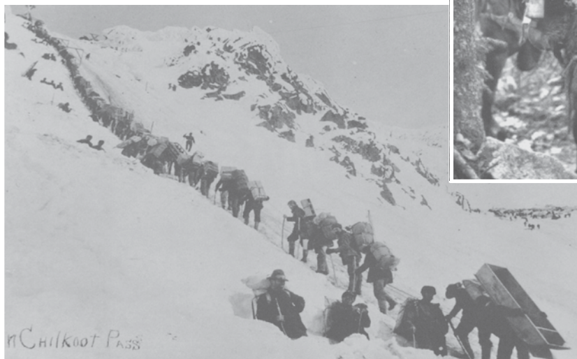
Guldgraver ca. 1900.

Skagways notoriske gangsterkonge Jefferson „Soapy“ Smith ligger begravet. „Soapy“ stod for bordeller, rulning, afpresning, spil og anden mere eller mindre lyssky aktivitet i Skagway. Han