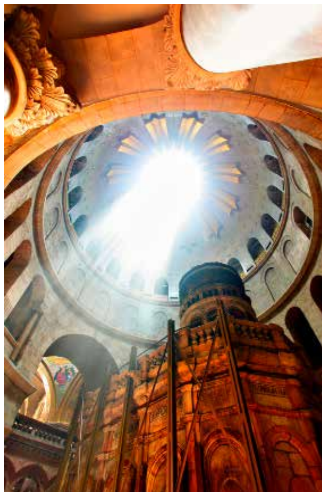
Rotunden med Gravkirken

befandt sig, stod på Tempelriddernes tid - og står stadig, når vi ankommer - den muslimske, ottekantede bygning: Klippekuplen. Den lavede Tempelridderne om til en kristen kirke, Templum