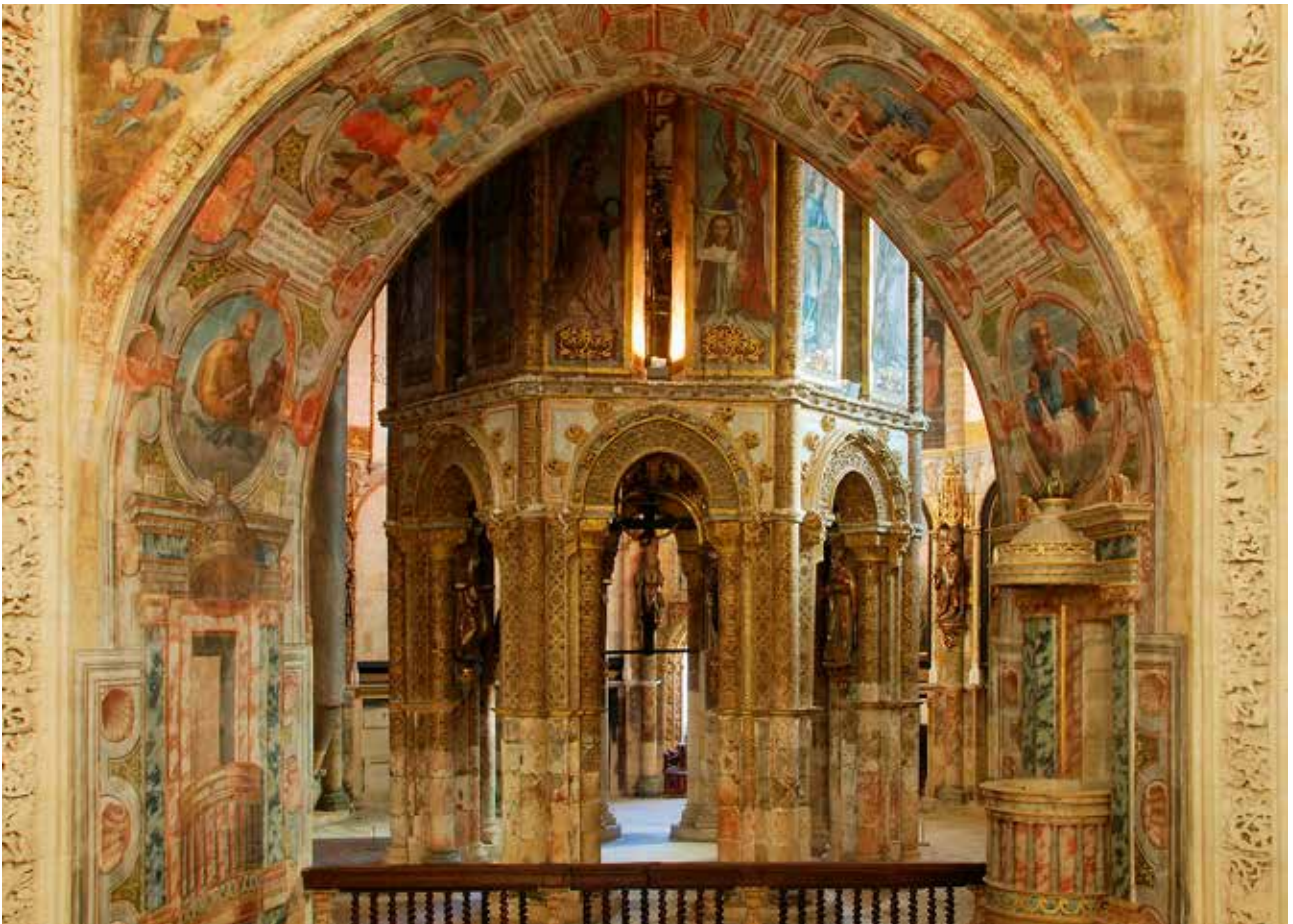
Interiør fra Tempelridder kirken i Tomar.

bliver kaldt "alle kirkers moder" – den overtager altså den rolle, som kirken på Zion-højen i Jerusalem havde haft.