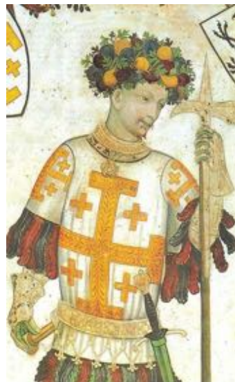
Godtfred af Bouillon

Nu dukker munkene fra Orval op igen. Der viser det sig, at de i mellemtiden har forberedt og allerede oprettet et kloster i Jerusalem. Det har de etableret i en bygning, der på Johannes Døberens tid var synagoge for den jødiske religiøse gruppe Essæerne. Det er også den bygning, hvor Jesus holder den sidste nadver med sine disciple, og det blev den første kristne kirke, som bliver kaldt "Alle Kirkers Moder".