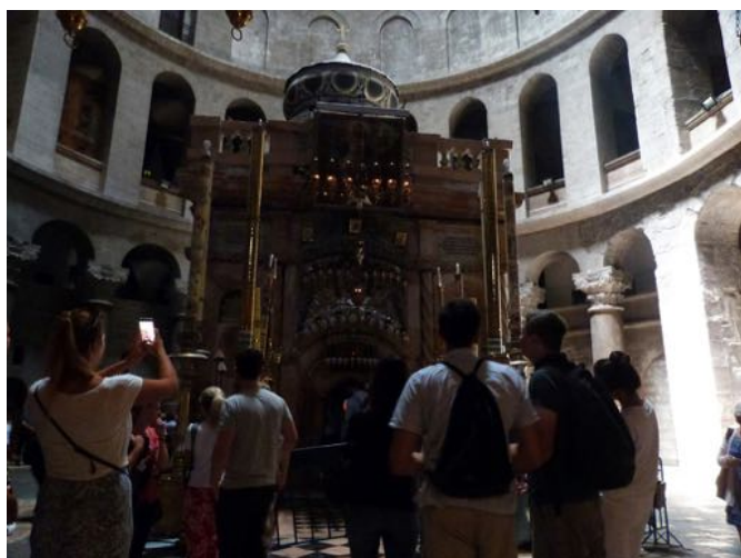
Den Hellige Gravs Kirke.

Men hvad de fleste turister i Den Hellige Gravs Kirke