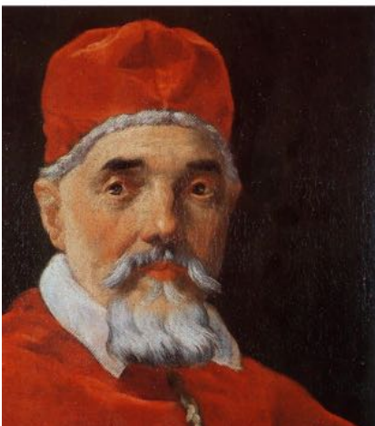
Pave Urban II

I virkeligheden hænger det sammen med, at det år bliver et medlem af de arveberettigede familier, den burgundiske adelsmand Odo af Châtillon, valgt til pave med navnet Urban II, og dermed har familierne undfanget en plan for, hvordan de kan få politisk kontrol over Jerusalem.