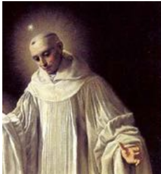
Robert af Molesme

De har erfaret, at dokumentet befinder sig i biblioteket i benediktinerklosteret Montier-la-Celle i Burgund. Klosters abbed, Robert (senere med tilnavnet: af Molesme), tilhører de slægter, der er de retmæssige arvinger. Desværre har han netop fået en ny stilling som abbed i klostret Saint Michelle-de-Tonnere. Men munkene sætter ham ind i situationen, og Robert vender derfor tilbage som abbed i Montier-la-Celle og fremskaffer dokumentet fra klosterets bibliotek.