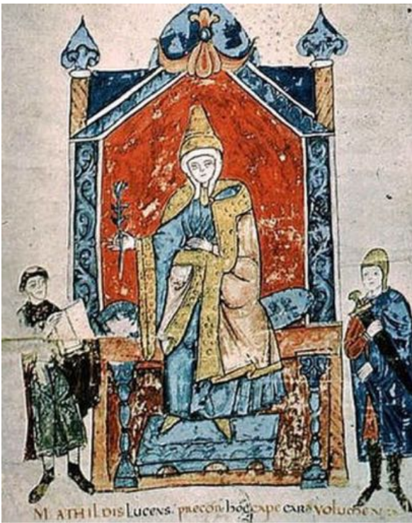
Mathilde af Toscana

I 1095 fører Urban II planerne ud i livet gennem familiernes opfindelse af begrebet "korstog" – og det virker.