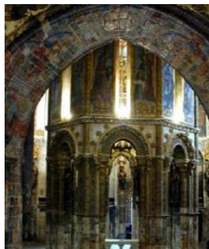
Borgen og det indre af rundkirken i Tomar.