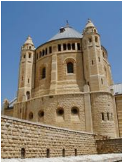
Alle Kirkers Moder

Ideen med at skabe en orden, hvor brødrene både er riddere og munke, er således allerede skabt af Godtfred af Boullion 18 år inden ni adelsmænd fra de burgundiske adelslægter i 1118 mødes i Jerusalem og stifter en tilsvarende orden af brødre, der er både