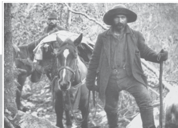
Guldgraver ca. 1900.