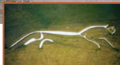
Uffington hesten set fra luften.