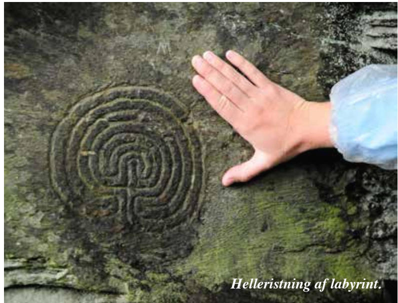
Helleristning af labyrint.

Frivillig afbestillingsforsikring: Koster 6%