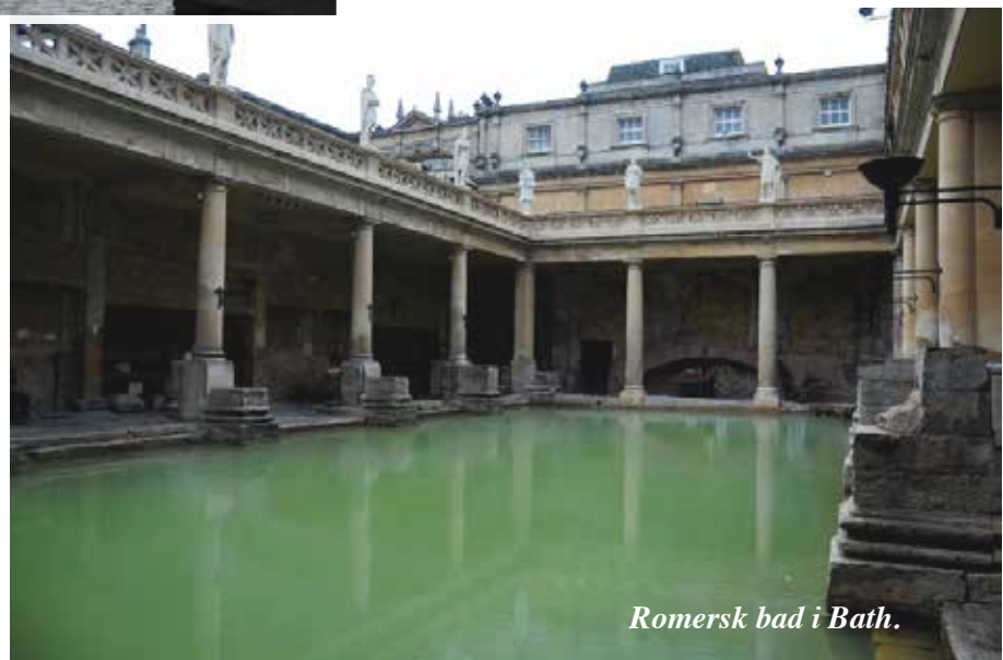
Romersk bad i Bath.

Vi skal også på jagt efter nogle flere tusinde år gamle helle-