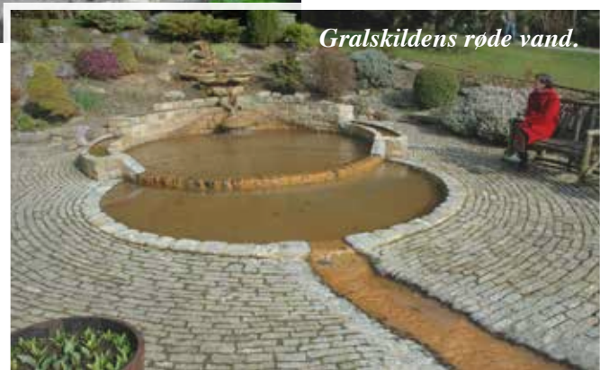
Gralskildens røde vand.

Dag 3. Heldagstur til Tintagel slot, der ligger i en dyb, sort slugt i Cornwall ved den engelske Atlanterhavskyst. Et dramatisk og naturskønt sted, hvor kong Arthur