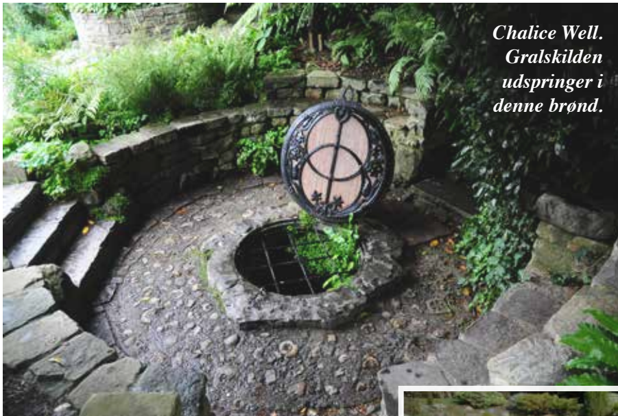
Chalice Well. Gralskilden udspringer i denne brønd.

ristninger af nogle små labyrinter! Mærkeligt nok har man fundet fuldstændigt identiske fortidslabyrinter i Burma og i Arizona.