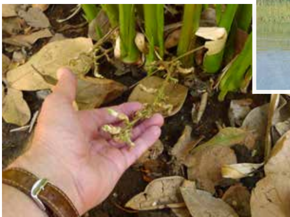
Øverst til venstre: Fiskere ved strandkanten i Cochin. Øverst til højre: Tempeltag i Madurai. Nederst til højre: Elefanter i Periyar vildtreservatet. Til venstre midt for: Peberplante. Nederst til venstre: Kardemomme.