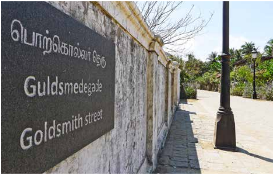
“Guldsmedegade” i Trankebar.

Stiplede linjer er flyruter. Faste linjer er rejse på landevej.