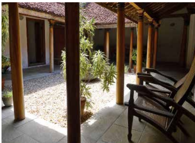
Til venstre: Trankebar villa med lille atrium. Restaureret af Bestseller fonden. Herunder: Port til Trankebar by og nederst: Den danske guvernørs bolig.