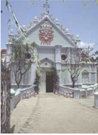
Ny Jerusalemkirken i Trankebar med Frederik d. 4's monogram