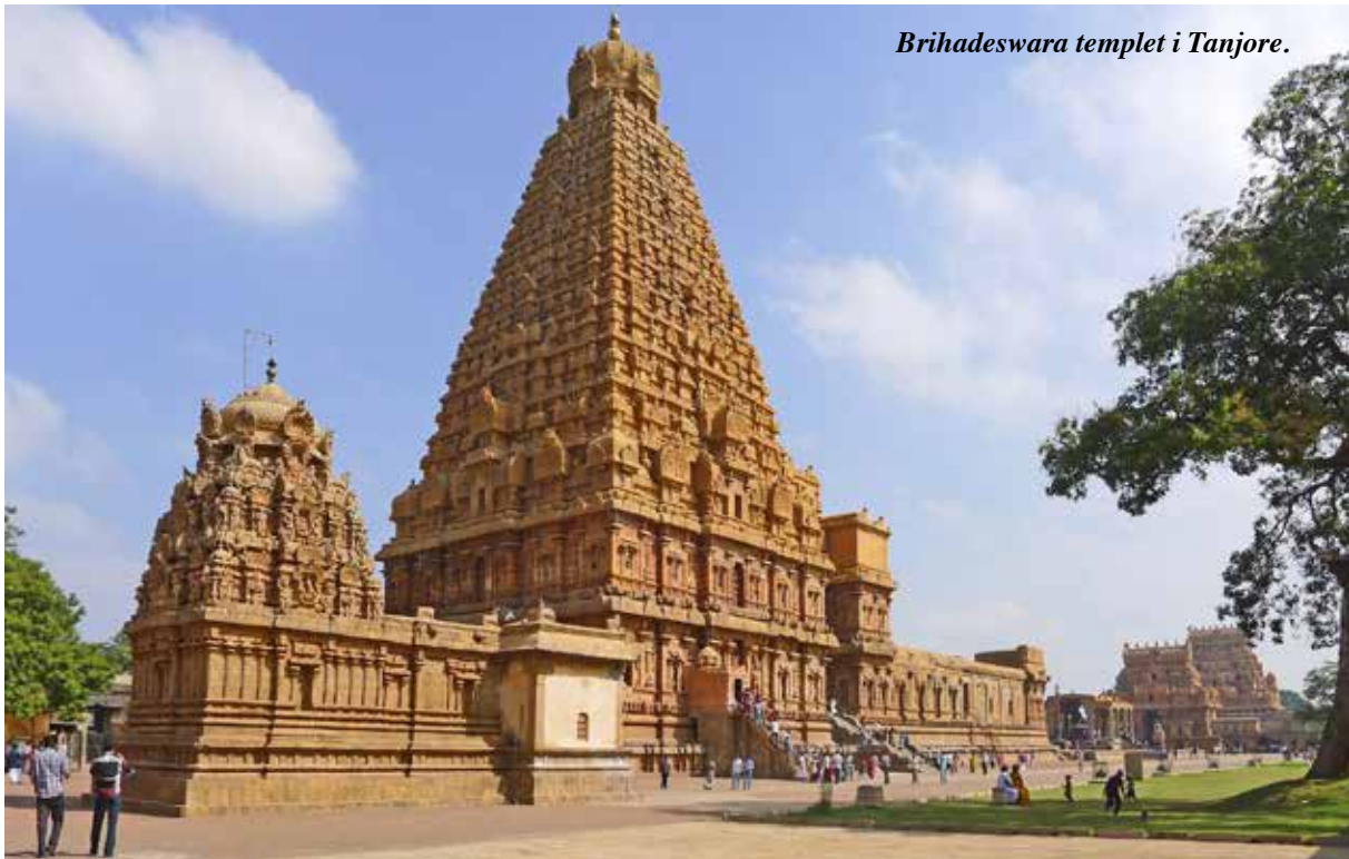
Brihadeswara templet i Tanjore.