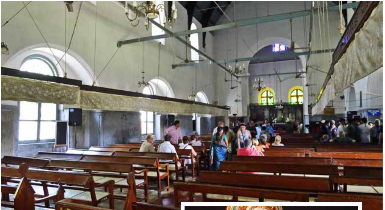
Foto øverst: I Vasco da Gamas gravkirke. De lange stænger med klædestof over bænkerækkerne er vifter. Vasco da Gama var en portugisisk søfarer, som i 1498 sejlede syd om Afrika til Indien - som den første nogensinde. Dette indvarslede undergangen for den ældgamle silkevej som handelsrute til Asien.

Foto til højre: Kathakali dansere. Fantastiske kostumer og ekstremt kontrolleret mimik er vigtige dele af denne dans.