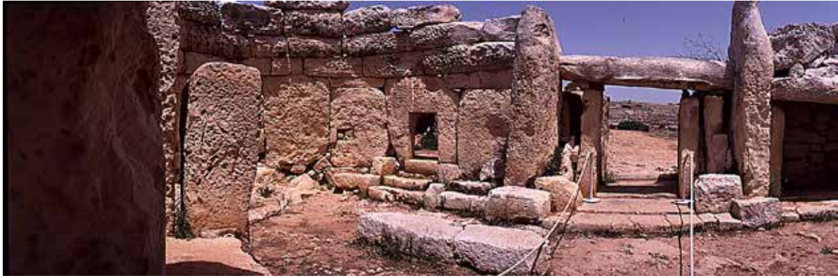
Herover: Parti fra Hagar Qim templet, som vi ser mandag d. 20. april.