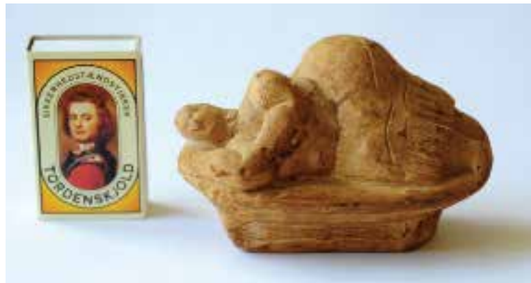
En kopi i størrelse 1:1 af "Den sovende gudinde."

Søndag d. 19. april: Fri dag. Vi arrangerer en udflugt til stenalderhulerne Hal Saflieni Hypogeum, hvor tusinder af mennesker blev begravet for 3.000 til 5.000 år siden. Hulerne er hugget ud af kalkklippen for årtusinder siden og består af et netværk af gange og kamre med røde bemalinger, orakelrum og gravnicher. Den lille keramikfigur "Den sovende