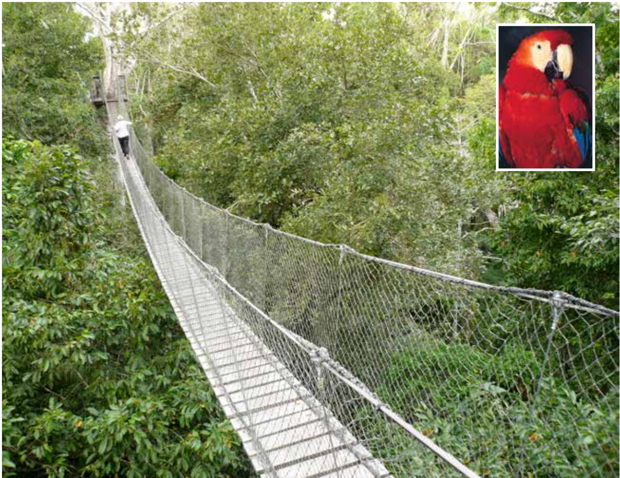
I hængebro fra trætop til trætop. Kanope vandring i Amazonas

fra trækrone til trækrone i 25 - 30 meters højde). Eller man kan besøge en lokal bonde og se afgrøder som fx. bananer, papaya, kokos, kakao, paranødder og citrusfrugter.