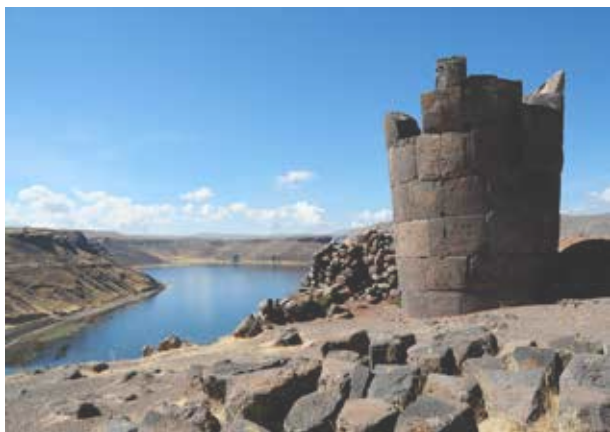
Gravtårn på Sillustani bjerget.

Efter frokost kører vi til grænsen mellem Peru og Bolivia. Herfra videre til Puno i Peru. Vi er fremme på vores hotel i Puno ved 18-tiden.