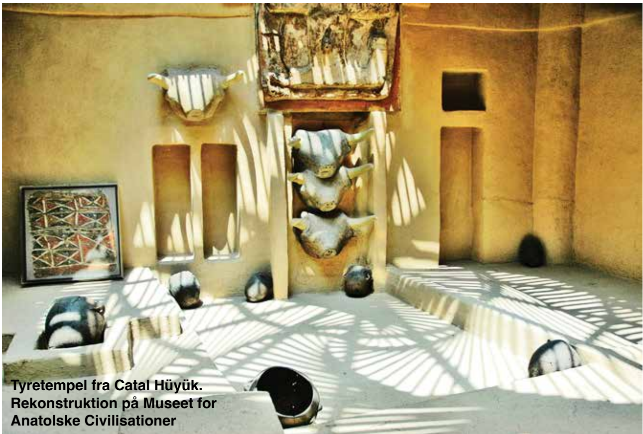
Tyretempel fra Catal Hüyük. Rekonstruktion på Museet for Anatolske Civilisationer

Dag 3. Vi flyver til fra Sanliurfa til Ankara, der er Tyrkiets hovedstad. Her skal vi besøge den gamle bydel - citadellet - med rester fra bl. a. romertiden. Byen blev grundlagt af keltere for 2.300 år siden. Men der er spor af langt ældre bebyggelser på stedet. Vi skal også se det meget fine Museum for Anatolske Civilisationer. På museet er der mange fund fra de meget gamle kulturer i Anatolien. Der er fund fra hittitterne og fra fortidsbyen Catal Hüyük, der med en alder på 8.000 år er en af verdens første byer.