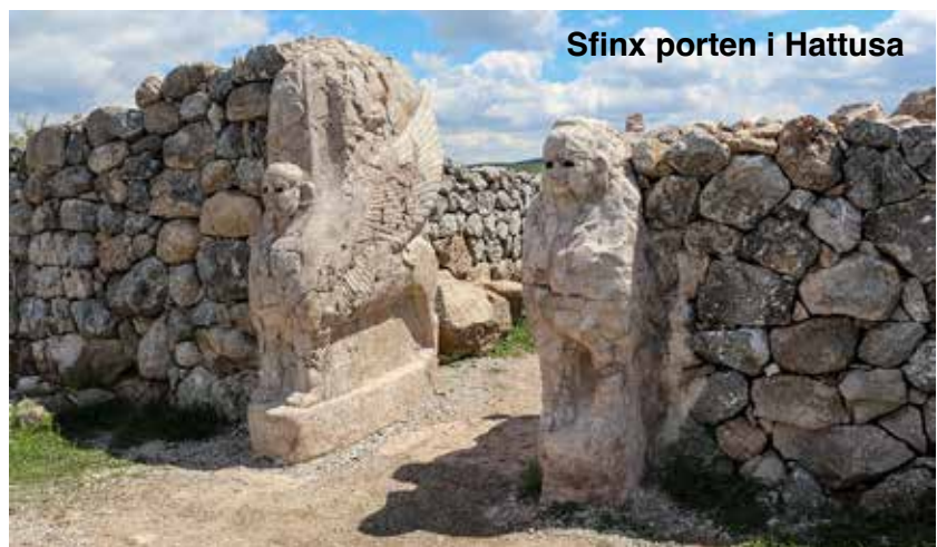
Sfinx porten i Hattusa

Hattusa var hovedstad i hittitternes magtfulde rige i Anatolien for 3.500 år siden. Hittitterne lærte kileskrift af de samtidige assyrere og arkæologer har i tidens løb fundet omkring 30.000 kileskrifttavler, som fortæller om hittitternes tanker og bedrifter. Hittitterne var en af oldtidens store kulturer og landet kæmpede bl. a. mod ægypterne i det berømte slag