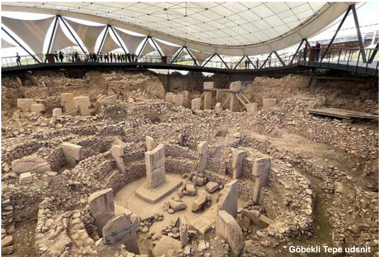
Göbekli Tepe udsnit