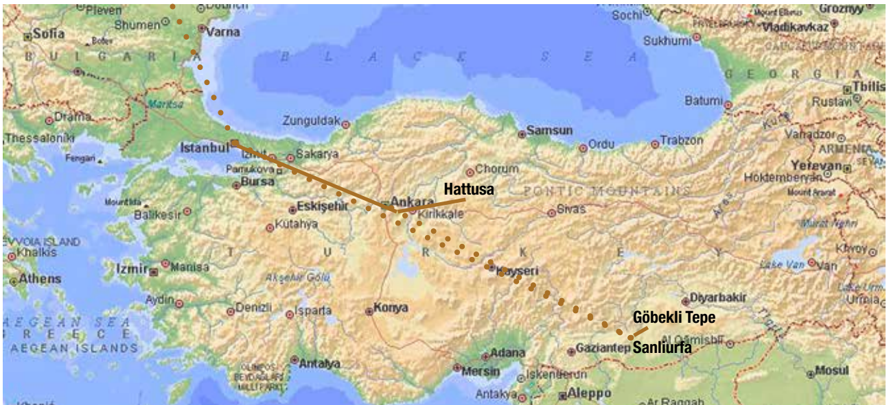
Punkterede linjer er fly forbindelser. Fast linje er landevejskørsel - dog tog fra Ankara til Istanbul.