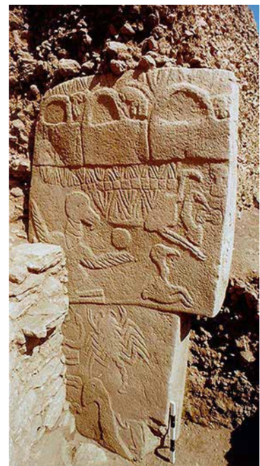
Søjle i tempel i Göbekli Tepe. Rigt udstyret med relieffer.

Vi spiser frokost i Sanliurfa, der er en over 2.000 år gammel handelsby grundlagt af grækerne. Senere blev byen et vigtigt knudepunkt for romere, byzantinere, korsfarere og muslimer. Byen har i dag særlig betydning for muslimer, idet det hævdes, at profeten Abraham blev født her.