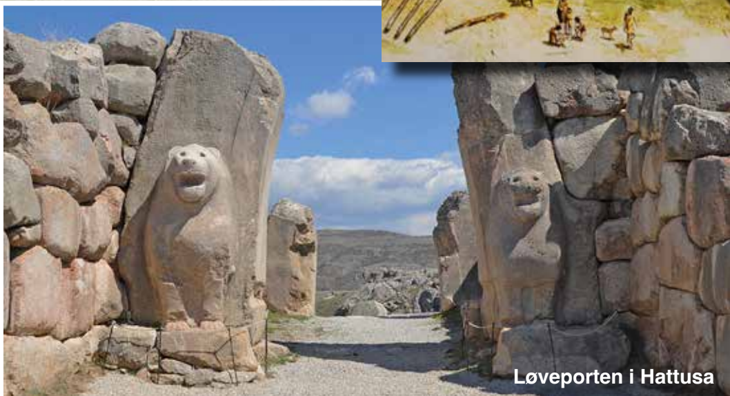
Løveporten i Hattusa