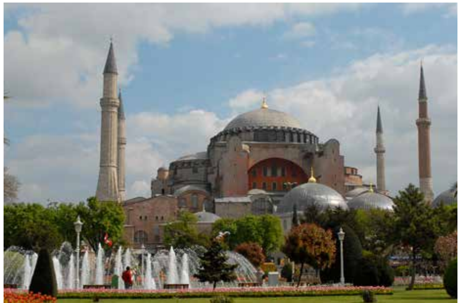
Øverst: Justinians cisterne. Flere af søjlerne er stjålet fra gamle fx. græske templer. Foto til venstre: Den snoede kobbersøjle stod oprindeligt foran Delfi templet i Grækenland. Den blev stjålet i byzantinsk tid og opstillet i hippodromen. Foto herover: Hagia Sophia kirken.

siden 1995. Komplekset består af tyve begravde runde stenhuse med fint tilhuggede søjler af hård limsten. Hver stenkreds måler fra 10 til 30 meter i diameter med mindre sten i periferien og højere sten i midten. Måske har kredsene engang været overdækket med et tag. Mange af søjlerne er dekorerede med dyrefigurer og symboler i fremhævet relief. Kulstof 14 målinger har vist, at Göbekli Tepe er op mod 12.000 år gammelt. Tempelkomplekset er således med en bred margin det absolut ældste i verden. Før Göbekli Tepe var de godt 5.500 år gamle templer på Malta de ældst kendte i verden. Den videre udforskning af Göbekli Tepe og reliefferne vil give os fantastisk ny viden om religion, kult