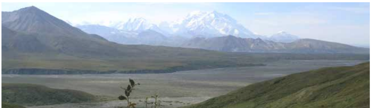
Fra Denali Naturpark. I baggrunden: Mt. McKinley.