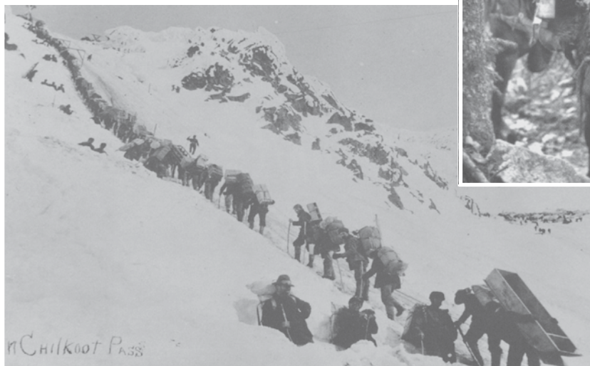
Guldgraver ca. 1900.

Skagways notoriske gangsterkonge Jefferson „Soapy“ Smith ligger begravet. „Soapy“ stod for bordeller, rulning, afpresning, spil og anden mere eller mindre lyssky aktivitet i Skagway. Han