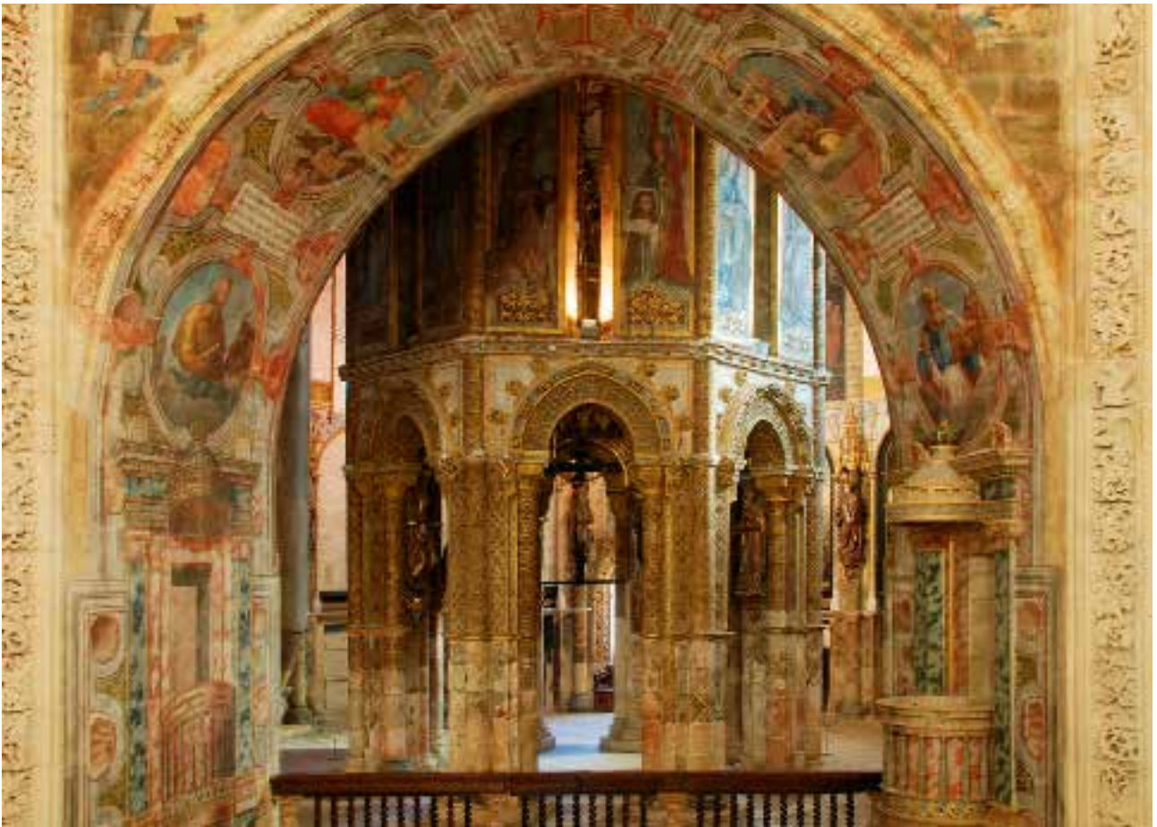
Interiør fra Tempelridder kirken i Tomar.

bliver kaldt "alle kirkers moder" – den overtager altså den rolle, som kirken på Zion-højen i Jerusalem havde haft.