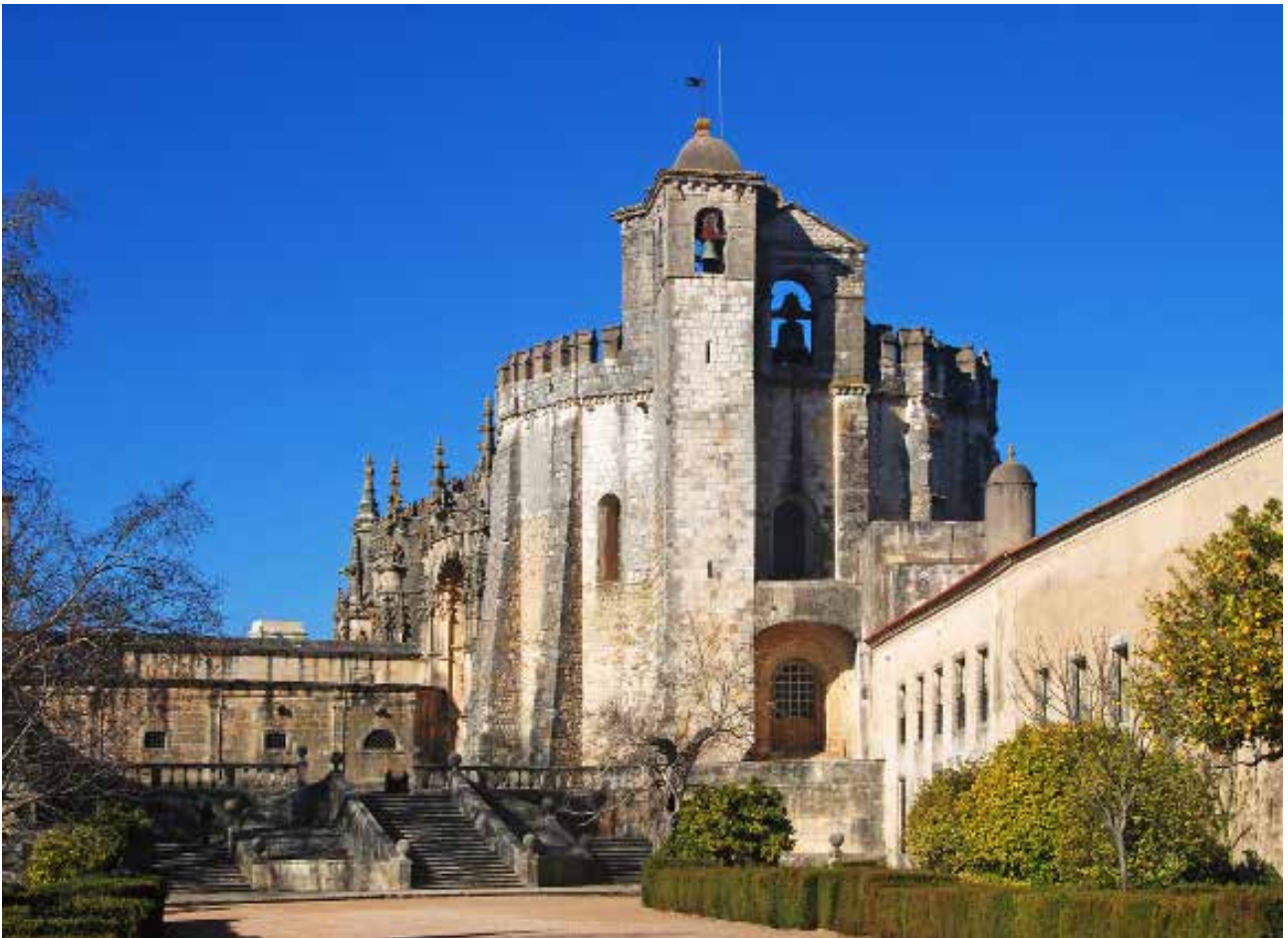
Den gamle Tempelridder kirke i Tomar.

- med mindre der var tale om genbrug. I området er der mange årtusindgamle grave.