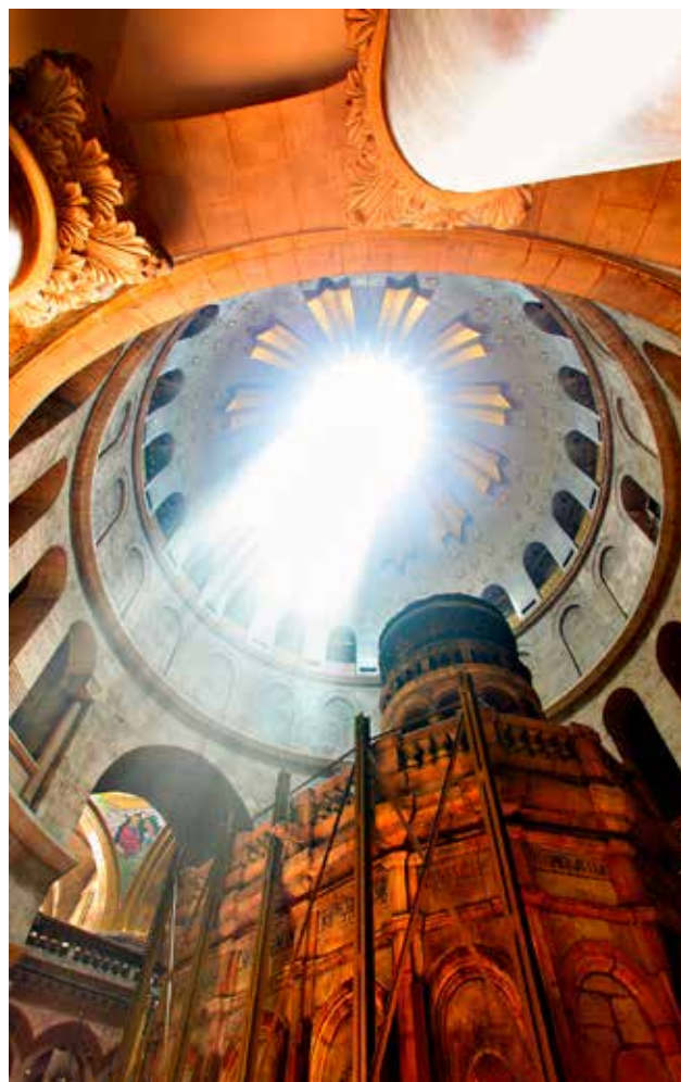
Rotunden i Gravkirken

Rotunden over graven blev bygget i 326 e.kr af den romerske kejser Konstantin den Store. Han gjorde stenen, hvorpå Kristus blev gravlagt, til centrum for kristendommen, det vil sige verdens centrum. Derfor lod han stenen omkranset af en cirkulær kirke. 365 år senere byggede muslimerne den ottekantede, hellige bygning Klippekuplen over den sten i Jerusalem, som efter den jødiske tradition er verdens centrum. Tempelridderne ønskede at forene de tre religioner og byggede derfor runde eller ottekantede