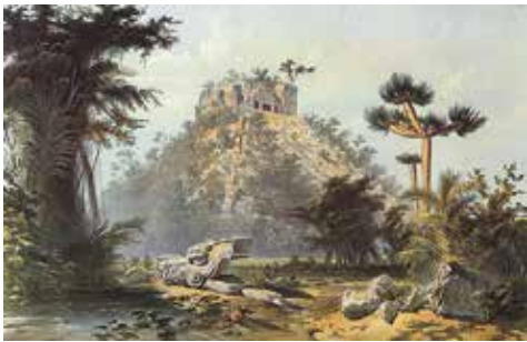
Catherwoods gengivelse af Kukulkanpyramiden i Chichen Itza som den tog sig ud i 1842.