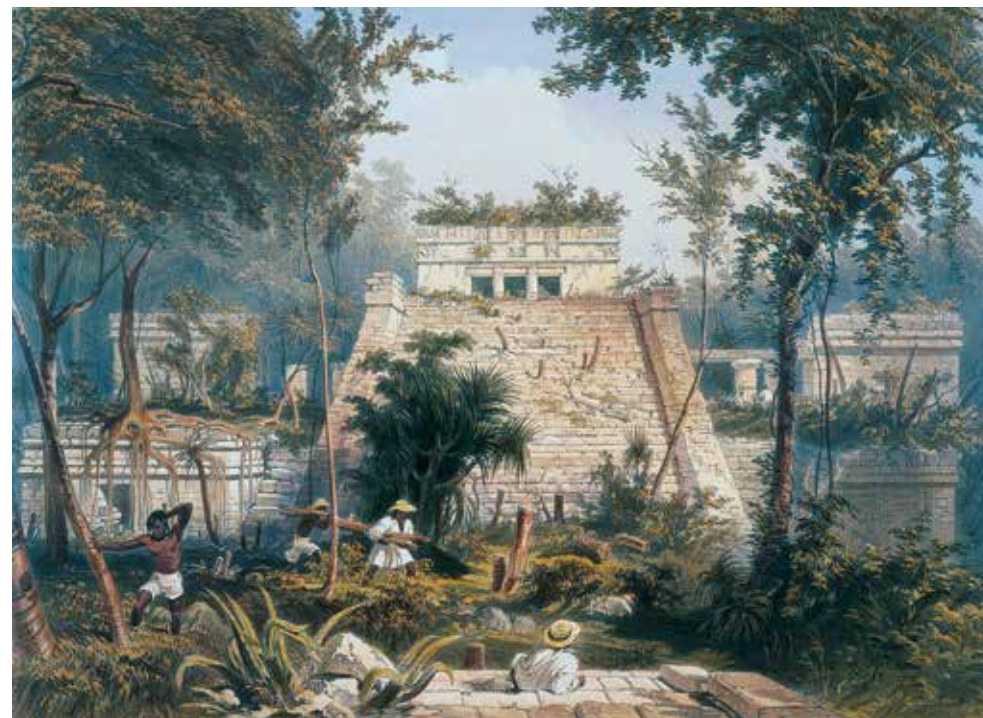
Catherwoods romantiske tegning af Tulum-templet, der ligger på Yucatans østkyst. Templet blev brugt af mayaer helt op i det 20. århundrede.

Thompson havde også studeret de stemningsfulde tegninger, som kunstneren og arkitekten Frederic Catherwood i 1840'erne lavede af tilgroede templer og pyramider i