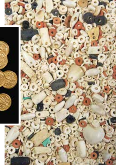
Skatten af perler fra Mesa Verde.

nær byen St. Albans i England, havde han selvfølgelig et håb om, at noget spændende og eventyrligt ville ske. Og det skete. På mindre end to timer fandt han en håndfuld romerske guldmønter fra omkring år 400. I alt lå der 159 guldmønter på stedet. Mønterne var en formue værd, og han fik senere en findeløn på 850.000 kr.