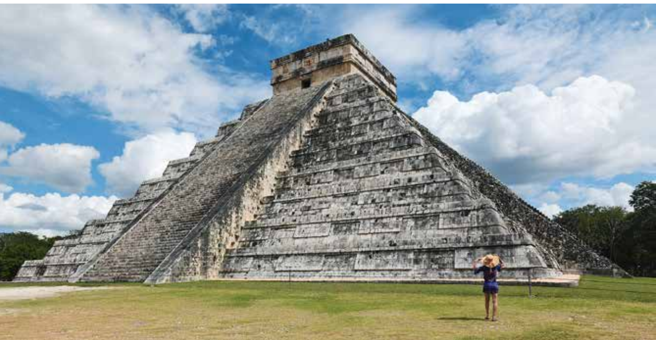
Foto af Kukulkanpyramiden i dag.