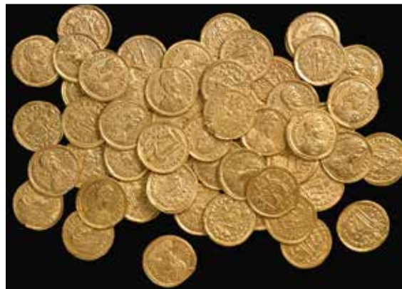
Nogle af de romerske mønter fundet i St. Albans i England.