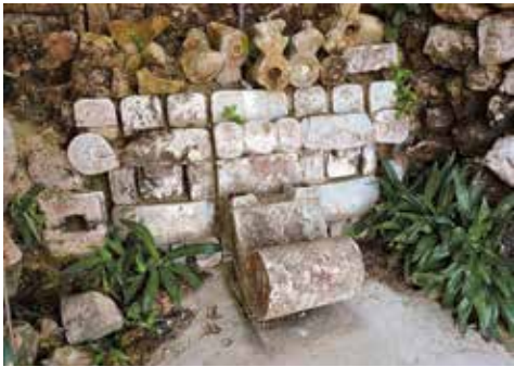
En stenmosaik af regnguden Chac, der er udstyret med en lille snabel (fra et tempel i Uxmal).