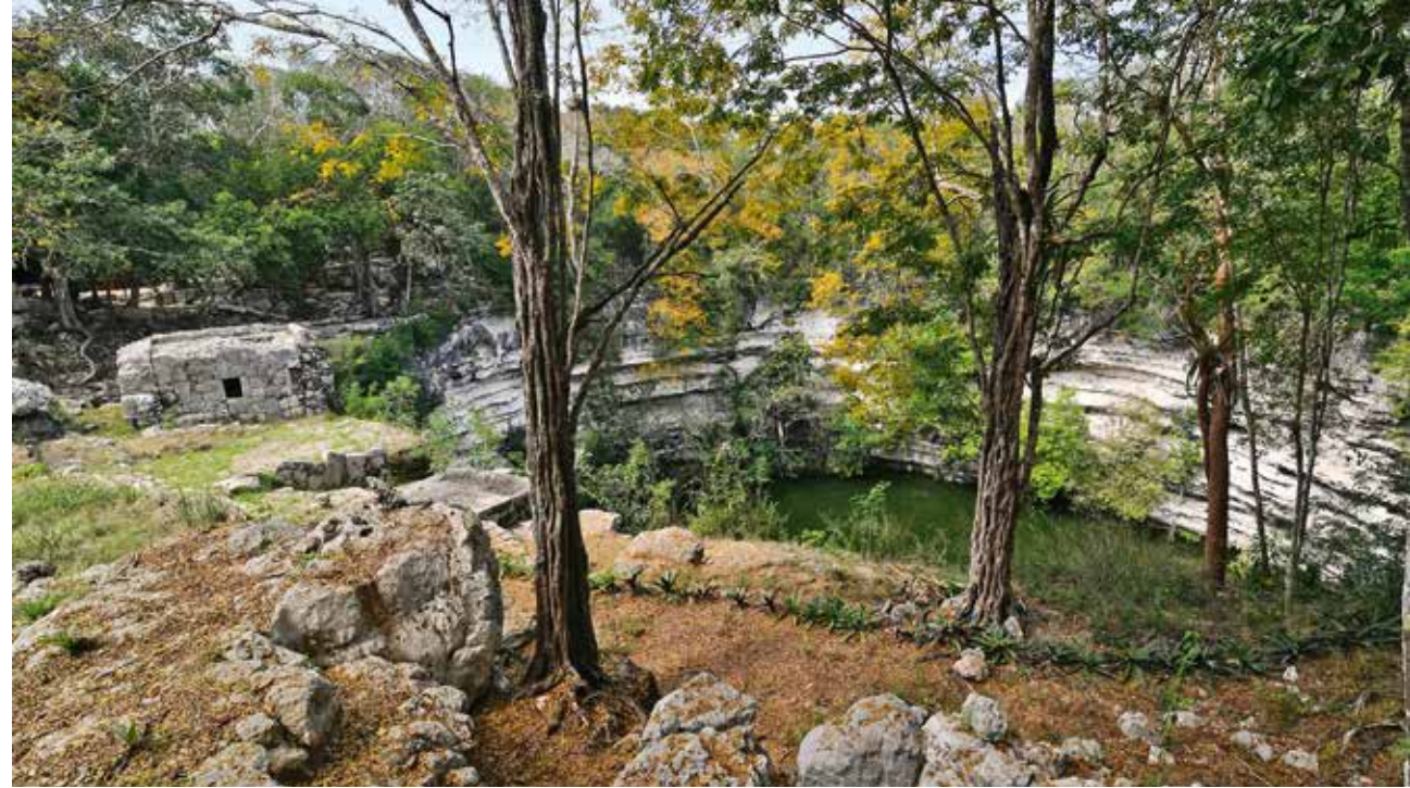
Offercenoten i Chichen Itza.

Det var i dette selskab af velhavere, at Thompson senere skulle møde den mand, der ejede Chichen Itza. De blev gode venner, og den unge amerikaner fik mulighed for at købe både ruiner, hovedbygning og et stykke jungle på størrelse med Als for ovennævnte 75 dollars. Det kan nævnes, at i dag er Chichen Itza et af de vigtigste turistmål i Mexico. Hver dag besøges stedet af over