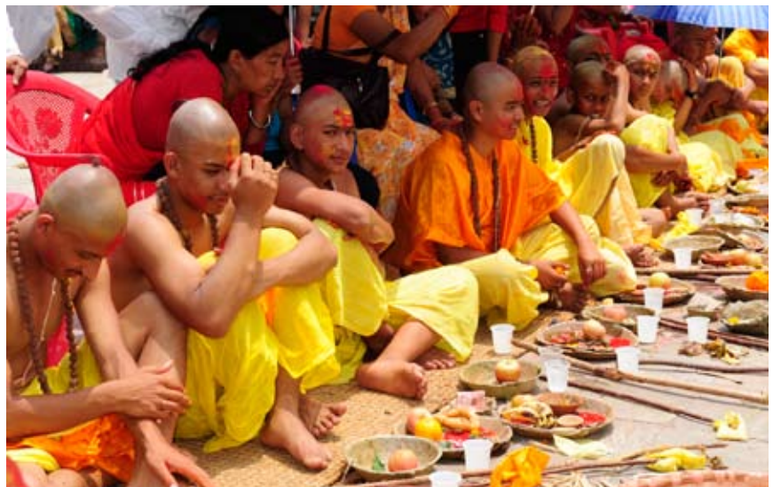
Indvielse af unge hindumænd i Pashupatinath.