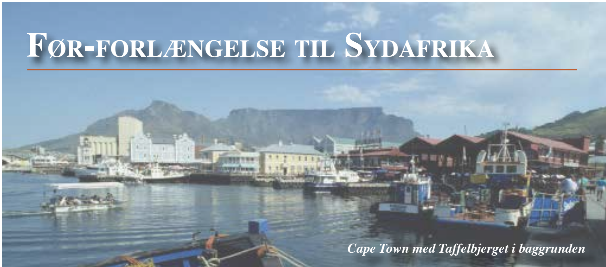
Cape Town med Taffelbjerget i baggrunden