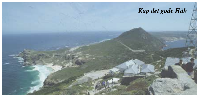
Kap det gode Håb

Dag 10. Se dag 3 i grundrejsen - og fortsæt herfra.