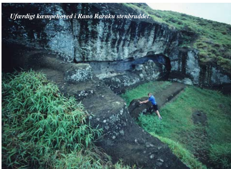
Ufærdigt kæmpehoved i Rano Raraku stenbruddet.

I en lang periode var en stor del af øen udlagt til fårehold, som ejedes af farmere fra fastlandet. Den lokale befolkning sneg sig imidlertid ud om natten og røvede fårene, så